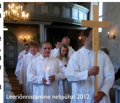
Leerionnistamine nelipühäl 2012.